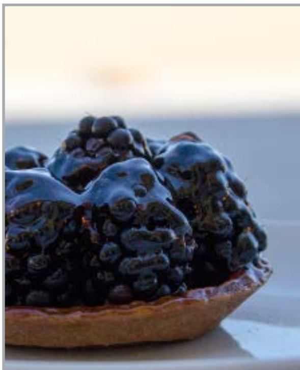
Tarte aux mûres