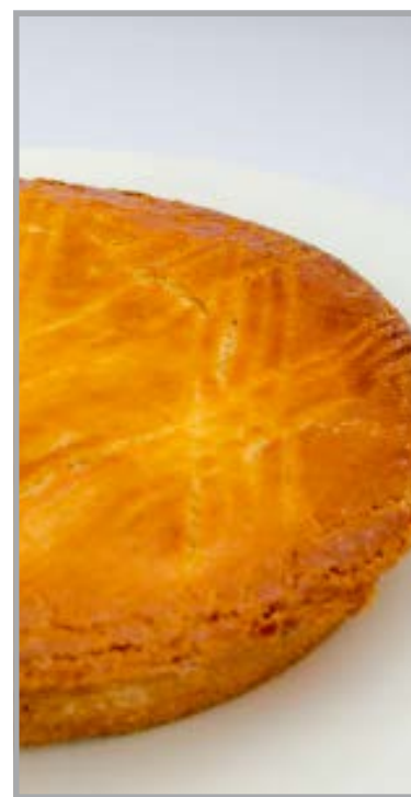
Gâteau Basque crème ou cerise

pâte sablée confiture cerise et cerises entières ou crème aux amandes