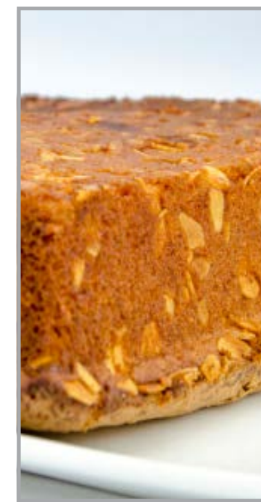
Pain de Gênes