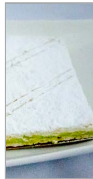
Russe Coco Pistache