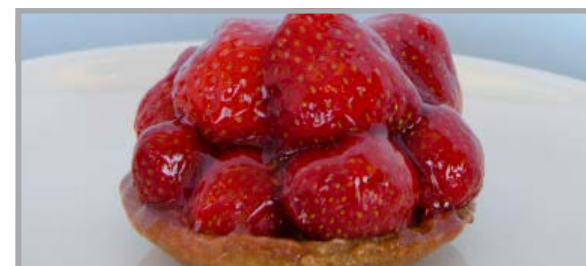
Tarte aux fraises

□ 4 personnes 14,80€ □ 6 personnes 22,20€